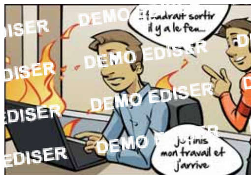
Ils vérifient que toutes les personnes ont bien entendu le signal d'alarme et qu'elles ont les lieux pour rejoindre le point de rassemblement.

Les autres occupants doivent être formés et informés sur la conduite à tenir en cas d'évacuation et les principaux signes de sécurité.