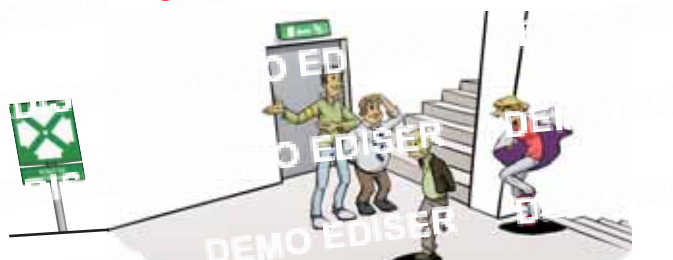
Ils dirigent les occupants vers le point de rassemblement.