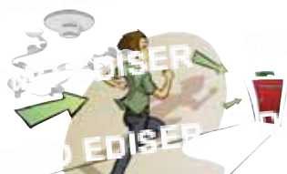
Identifier les moyens d'aide à l'évacuation