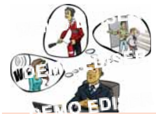
Faire évoluer l'organisation si nécessaire