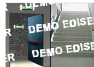
Dégagements aux escaliers