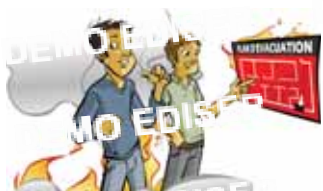
Placer l'établissement en zones de risques

Les points clés de la stratégie d'évacuation :