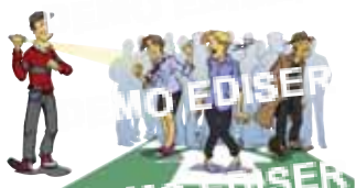
Déterminer les points de rassemblement