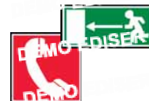
Signalisation de sécurité