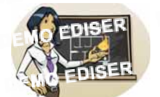
Former le personnel d'encadrement à l'évacuation