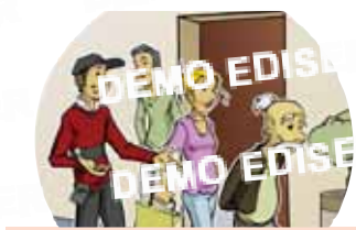
Réaliser des exercices d'évacuation.